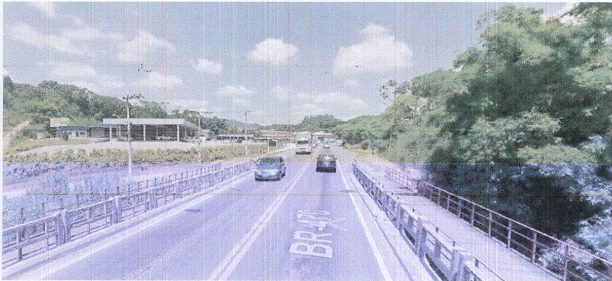
Ponte BR 470 (Município de Blumenau).