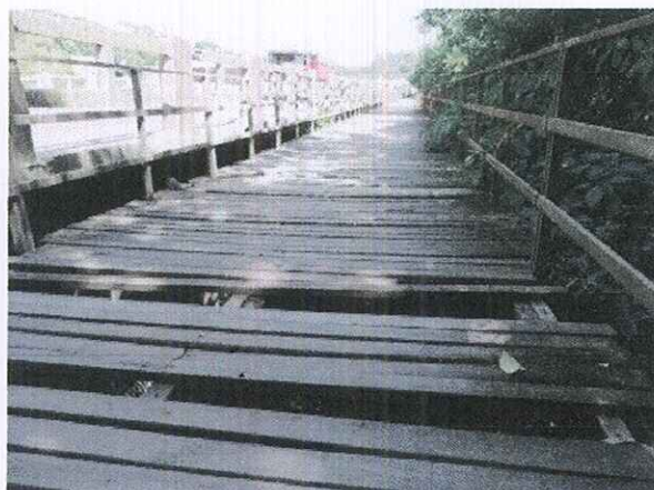
Foto: piso da passarela danificado.